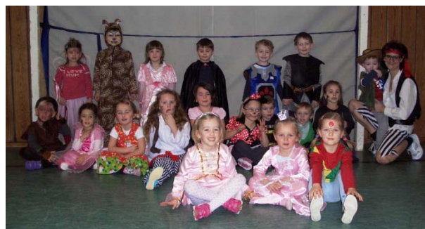
1. Gruppe Fasching 2015

Für Spaß und Spiel ist im Februar aufgrund der 5. Jahreszeit gesorgt. Genau, wir sind ja mitten im Fasching! Natürlich gehört da auch unser Faschingsturnen , heuer am 03.02.2016 , dazu. Als was werdet ihr heuer kommen?