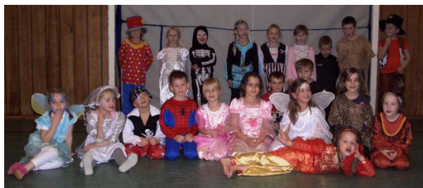
2. Gruppe Fasching 2015

Wie ihr ja wisst, sind dann gleich die Faschingsferien und wir sehen uns am 17.02.2016 wieder beim Turnen. Bis dahin wünschen wir Euch eine schöne und lustige Faschingszeit,