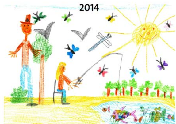
Ferienmalwettbewerb - Karlskron ist bunt